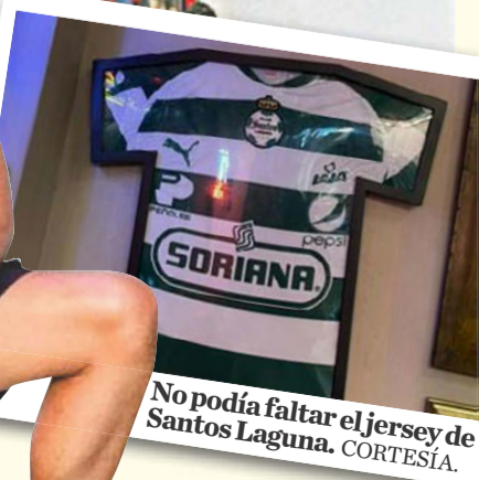
No podía faltar el jersey de Santos Laguna.