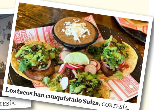
Los tacos han conquistado Suiza.